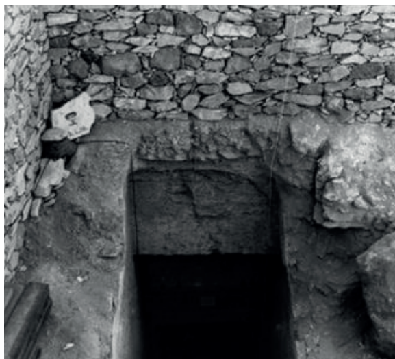
Schody vedoucí do Tutanchamonovy hrobky

Údolí králů leží ve městě mrtvých (pohřebišti) na západním břehu Nilu naproti Thébám (dnešní Luxor). Údolí se stalo místem pohřbu téměř všech králů Nové říše (18. až 20. dynastie, 1543 až 1069 př. n. l.). Tutanchamonoova hrobka a předměty, které v ní byly objeveny, nám umožňují nahlédnout do života ve starém Egyptě. Objev téměř nedotčené faraonovy hrobky se stal obrovskou senzací.