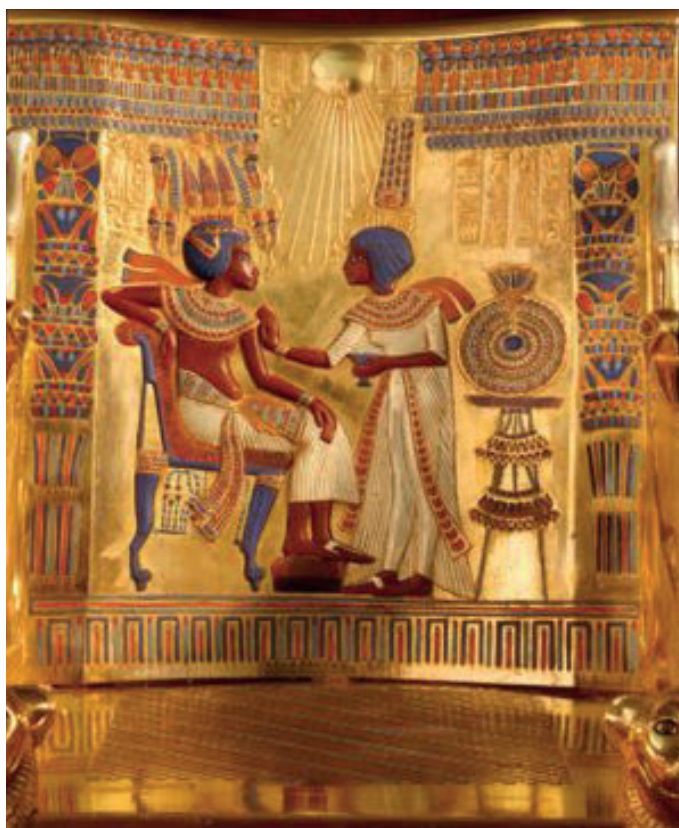
Detail opěradla zlatého trůnu krále Tutanchamona

Faraon Tutanchamon se oženil s Anchesenamom, třetí dcerou faraona Achnatona a Nefertiti, tedy se svou starší nebo nevlastní sestrou. Tutanchamon vládl pouze devět let. Za jeho vlády se hlavním městem království stala Memfida. Egypt se navrátil ke starým bohům, čímž zrušil otcovu víru v jednoho boha. V chrámu v Karnaku byla vztyčena obrovská stéla, na které Tutanchamon oznámil svůj návrat ke starému náboženství. Théby se staly náboženským střediskem Egypta. Tutanchamon stál v čele dobře organizovaného státu. O administrativu se staralo mnoho úředníků. Kněz Aje, který byl pravděpodobně otcem královny Nefertiti, byl jedním z nejdůležitějších rádců Tutanchamona. Generál Horemheb byl velitelem ozbrojených sil. Země se pod Tutanchamonovou vládou vrátila ke svým starým tradicím. Tento návrat byl důležitým krokem ke stabilizaci království. Když Tutanchamon na jaře roku 1323 př. n. l. zemřel ve věku pouhých 18 let, vystřídal ho na egyptském trůnu jeho rádcé Aje.