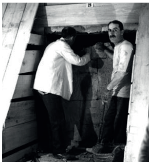
Howard Carter při práci v pohřební komoře

Brzy si byli všichni jistí, že objevili hrobku krále Tutanchamona. První článek o nález hrobky vyšel 30. listopadu 1922 v anglických Timesech. Senzační objev byl oslavován v médiích po celém světě. Howard Carter dal okamžitě dohromady odborný tým. Jednotlivé prostory hrobky byly důkladně vědecky katalogizovány a vyčištěny. Tyto práce trvaly 10 let a z hrobky bylo vyneseno přes 5900 předmětů. Výstava TUTANCHAMON – JEHO HROBK A POKLADY ukazuje komory hrobky přesně tak, jak je Howard Carter a lord Carnarvon objevili.